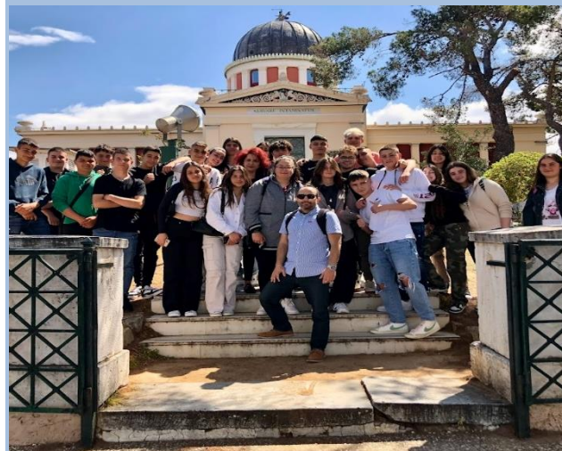
Στο Γεωδυναμικό Ινστιτούτο ως Εκπαιδευτικός και υπεύθυνος προγράμματος σχολικών δραστηριοτήτων.